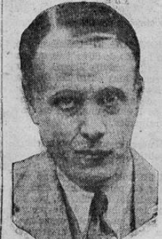
Sinclair Lewis, escritor americano, quien acaba de ganar el premio Nobel de literatura de 1930.