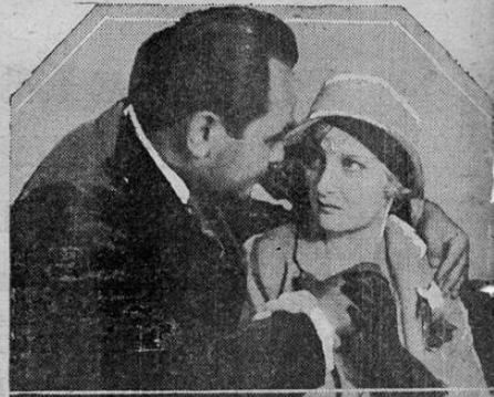
EDWARD G. ROBINSON and MARY NOLAN in "OUTSIDE THE LAW" A UNIVERSAL PICTURE