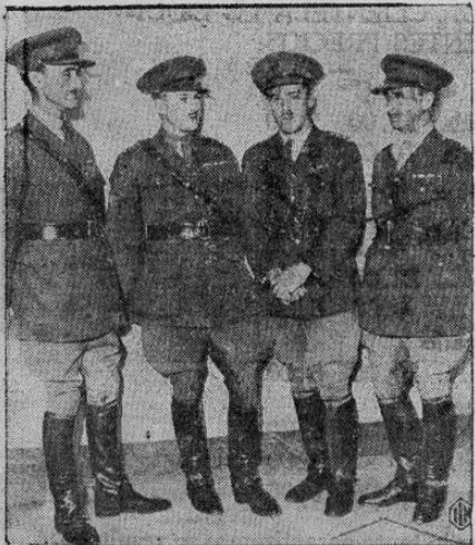
Los oficiales canadienses que forman el team del Canadá en la Exposición de Equitación que tiene lugar en el Madison Square Garden de Nueva York. Estos oficiales han tenido una actuación brillante en los diferentes concursos de equitación