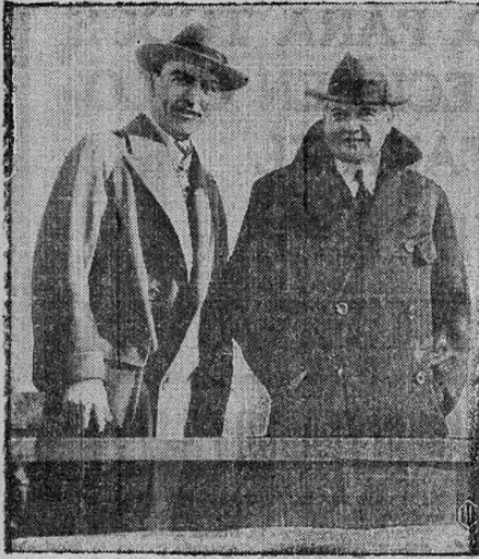
El Presidente Hoover con el Capitán Eddie Rickenbacker, después de presentarle al último la Medalla de Honor del Congreso por sus heroicas batallas aéreas durante la gran guerra